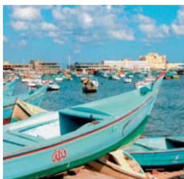
An der Corniche – im Hintergrund die Zitadelle – präsentiert sich Alexandria europäisch.