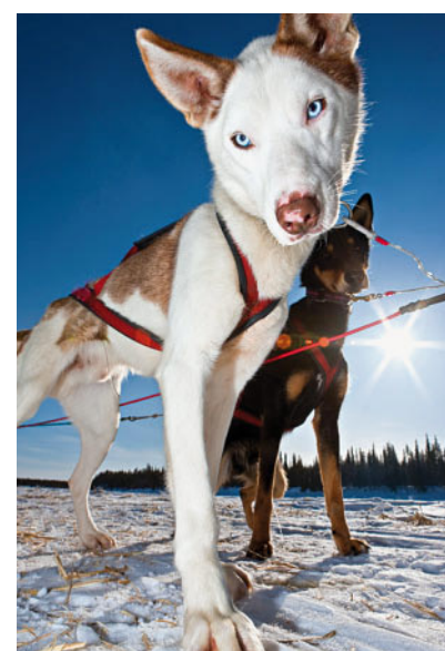
Husky-Touren gehören im Winter zum Standardprogramm

inzwischen auch im Winter: „Die ersten Kunden in diesem Winter waren begeistert – auch wenn einige von ihnen zunächst skeptisch waren“, berichtet Lehmkuhler.